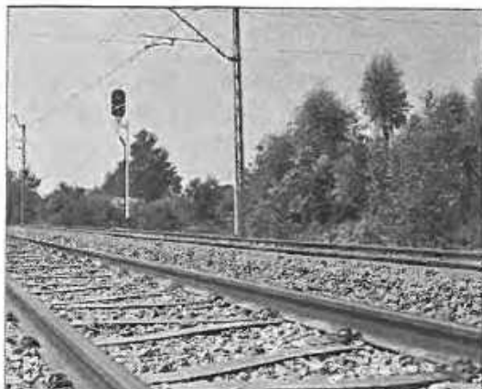
Mateusz Kopeć Railway gft Polska sp. z o.o.