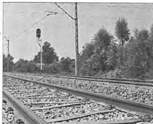
Mateusz Kopeć Railway gft Polska sp. z o.o.